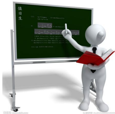
图1 xxxx图名称，居中，黑体5号